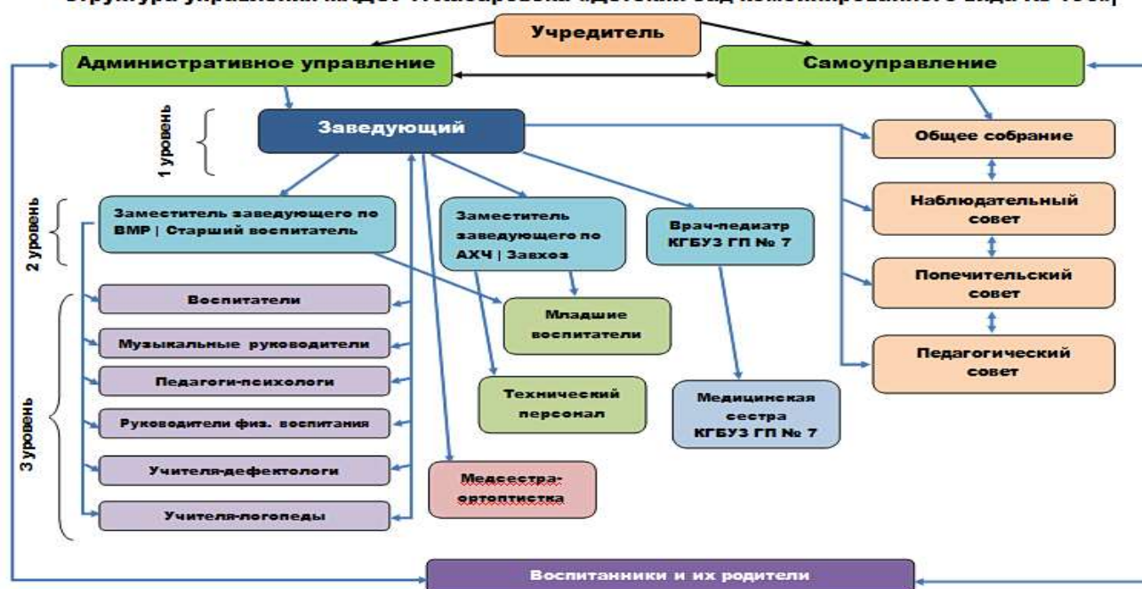
Структура управления МАДОУ г. Хабаровска «Детский сад комбинированного вида № 196»

Для полноценного функционирования и эффективного развития в ДООУ разработаны все необходимые локальные акты, ознакомится с которыми может каждый желающий на сайте учреждения.